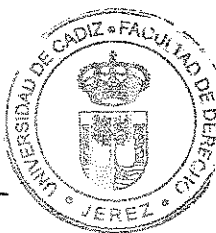
Departamento Derecho Público